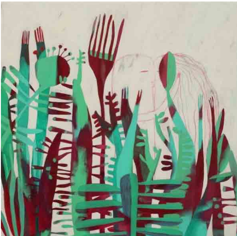
Vegetación (M. A.)

M. A. Primero me fui a Brasil con una beca de la AECID, a la isla de Florianópolis, donde recibía y daba clases en un área que me interesaba mucho y que en España no era una asignatura, la estampación textil. Yo ya había hecho una de las técnicas, batik , porque está muy vinculada con el grabado. Fue una experiencia fantástica, conocer el país, pero también viajar con otros compañeros de beca hasta Buenos Aires... Luego hice mi doctorado en Cuba, sobre el grabado durante el periodo de la Revolución. Y fue muy enriquecedor. Investigué sobre cómo está muy marcado por el contexto social, mucho más que en Europa u otras regiones donde no tienes por qué reconocer el origen del artista por su trabajo. Sin embargo aquí está muy presente, en los materiales, que por la situación económica, a veces, utiliza mucho el reciclaje, y en la temática, ya sea a favor o en contra de la Revolución.