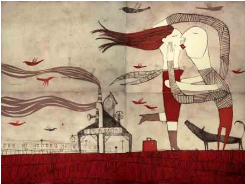
La tarde que llegaste (M. A.)