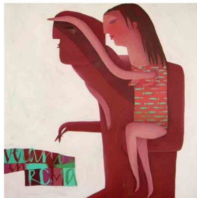
Verano en Roma (M. A.)