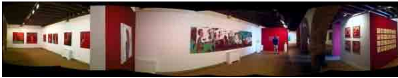
Exposición "Y llegaste" en el Castillo Santa Catalina, en Cádiz (Patricia Simón)

Lo dicho, mucho amor por el trabajo y muy poca cursilería.