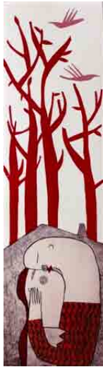
Casas (M. A.)

M. A. Obviamente me interesan infinitud de temas, pero tienes que elegir y me interesa esa parte de la vida para plasmarla en mi obra. La reflexión en donde me gusta quedarme para pintar, para transmitirla en mi trabajo, es esa parte bonita de la vida. Me parece importante, me gusta dibujar ese tipo de cosas porque me tengo que imaginar ese instante y prefiero pensar en ese momento de felicidad, que en lo que puede rodear a esos personajes, de tristeza o problemas que seguro que existen.