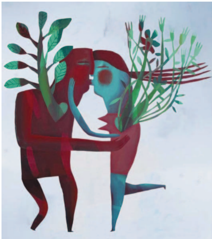
Y Ilegaste (Marina Anaya)

Un mundo acuoso, de líneas redondeadas, nacidas para encajar las unas en las otras y fundirse en un abrazo y, a veces, en un beso. Figuras vertebradas, robustas, que encuentran gracia en los extremos que más tentación de ser palpados provocan: labios, pechos, manos. Y como frágiles pilares, unos pies que a menudo se suspenden en el vacío para alcanzar al otro. Pinturas, pero también grabados, dibujos, esculturas y bocetos.