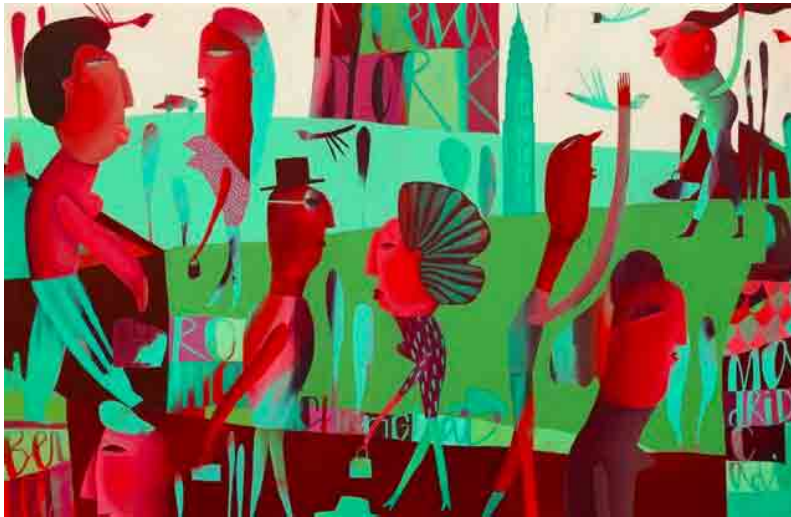
Berlín - Cádiz (M. A.)